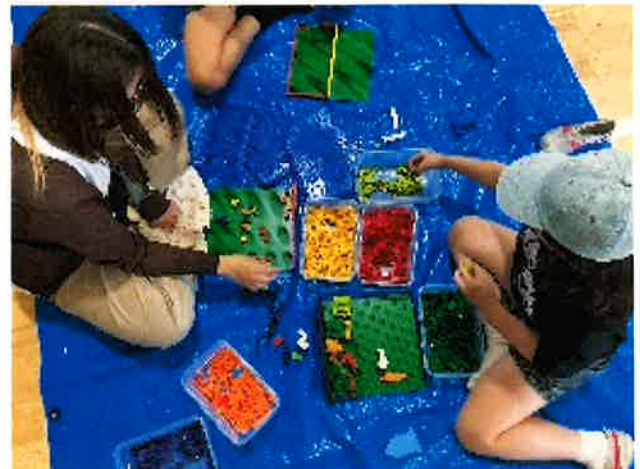
▲5月に入って遊ぶお子様が増えたブロック遊び。 丁寧に色を選び、じっくり時間をかけて家や家具を作っています。異学年で遊ぶ場面もよく目にします。