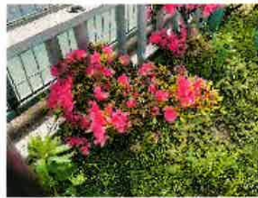
▲いろいろな花の香りをかぎ比べる姿もあります。