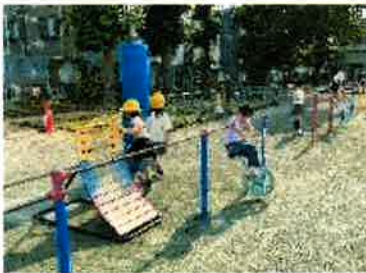
▲サッカーに一輪車。毎日、時間いっぱい遊んでいます。