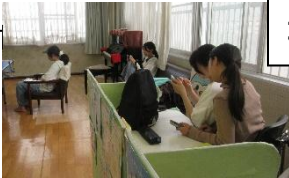
真剣な顔でゲームに夢中(笑)