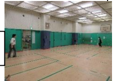
今日は仲良くテニス！！😊

最近はお球遊び、バスケ、バドミントンなどで盛り上がってるよ♪部活の練習などにも利用できるのよ、気軽に相談してね。※バスケをやりたい子はバッシュを持って来てね。