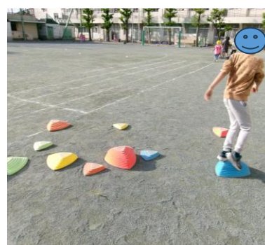
バランスストーン