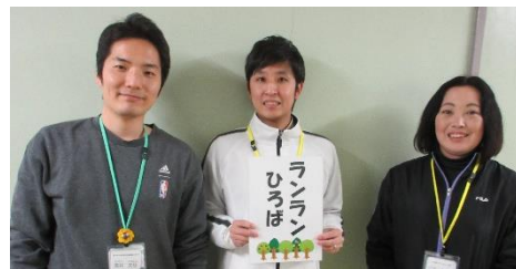
【左から施設長・主任・副主任】