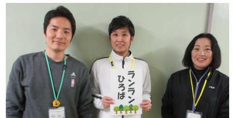
【左から施設長・主任・副主任】